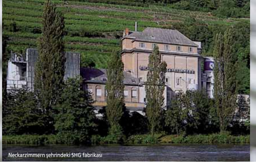
Neckarzimmern şehrindeki SHG fabrikası