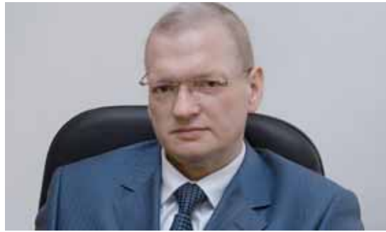
Alexander Krjuchkov, Nizhny Novgorod bölgesinin vali yardımcısı geri kazanım endüstrisine giriş yapmaya kararlı

Alexander Krjuchkov: Dzershinsk'te atıkların evlerin yakınından toplanmasına başlıyoruz. Hedefimiz, ayrı olarak istiflenen atıklardan tali hammaddeleri kazanmak ve tekrar üretim döngüsüne dahil etmek. Bu yolla, tali hammadde kaynağı olarak kullanarak geri kalan atık miktarını azaltabiliriz ve aynı zamanda çöp toplama tesislerimizin yükünü azaltabiliriz.