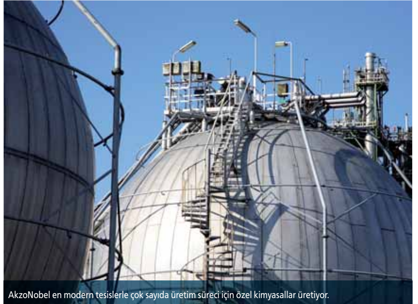
AkzoNobel en modern tesislerle çok sayıda üretim süreci için özel kimyasallar üretiyor.

REMONDIS Aqua bunun için önce, kimyasal-fiziksel temizlik aşamalarından ve biyolojik işlemde oluşan mevcut iki aşamalı işlemin kapasitesini genişleten bir geliştirme konsepti geliştirdi. Atık su, daha sonra doğrudan liman sularına aktarılacak üzere tesiste tamamen temizleniyor.