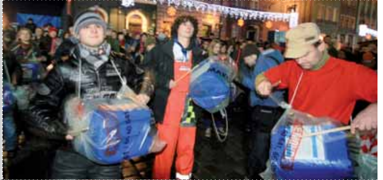
▲ BM iklim konferansı vesilesiyle Poznan'daki yeniden değerlendirme şenliği