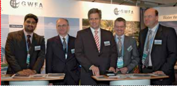
◀ İstanbul Dünya Su Forumu'nda GWFA.