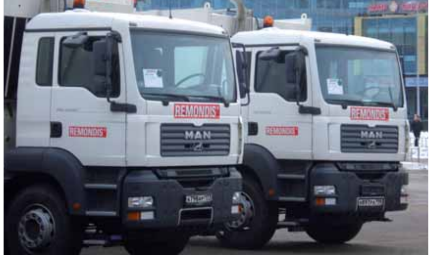
REMONDIS'in Dzershinsk şehrindeki yeni araç filosu kullanılmaya hazır.

Hızlı başarılar elde etmek için Public Private Partnership (Kamu Özel Ortaklığı), yani REMONDIS Dzershinsk başlatıldı. Bu sayede yeni altyapıların oluşturulmasına başlanabilir. Şu anda konut atıkları ana konu. Bundan dolayı şirket derhal çağdaş toplama araçlarına ve depolara yatırım yaptı. Madde döngülerini tamamlayabilmek için cam, eski kağıt ve plastiğin ayrı olarak toplanmasına başlandı. REMONDIS