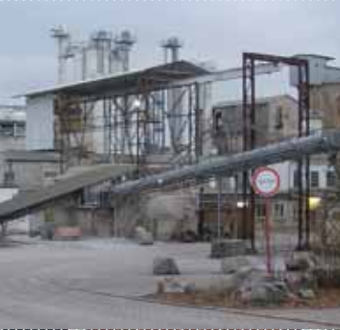
◀ Södharzer Gipswerke, Osterode Dorste fabrikası